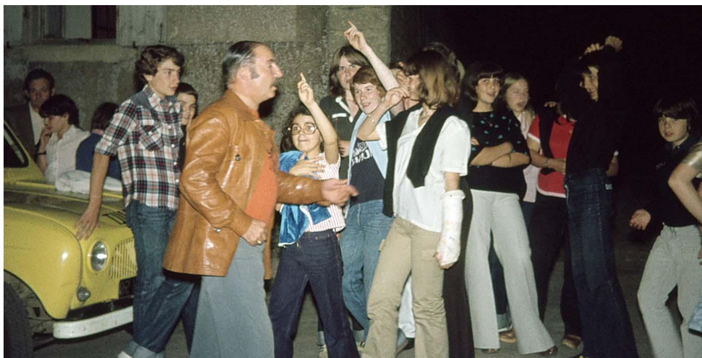
Et maintenant ... place aux jeunes ! Les reconnaissez-vous ? ... Vous reconnaissez-vous ?!